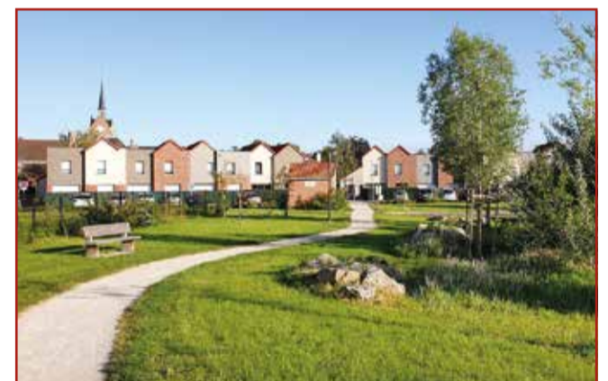
A pied au cœur du village