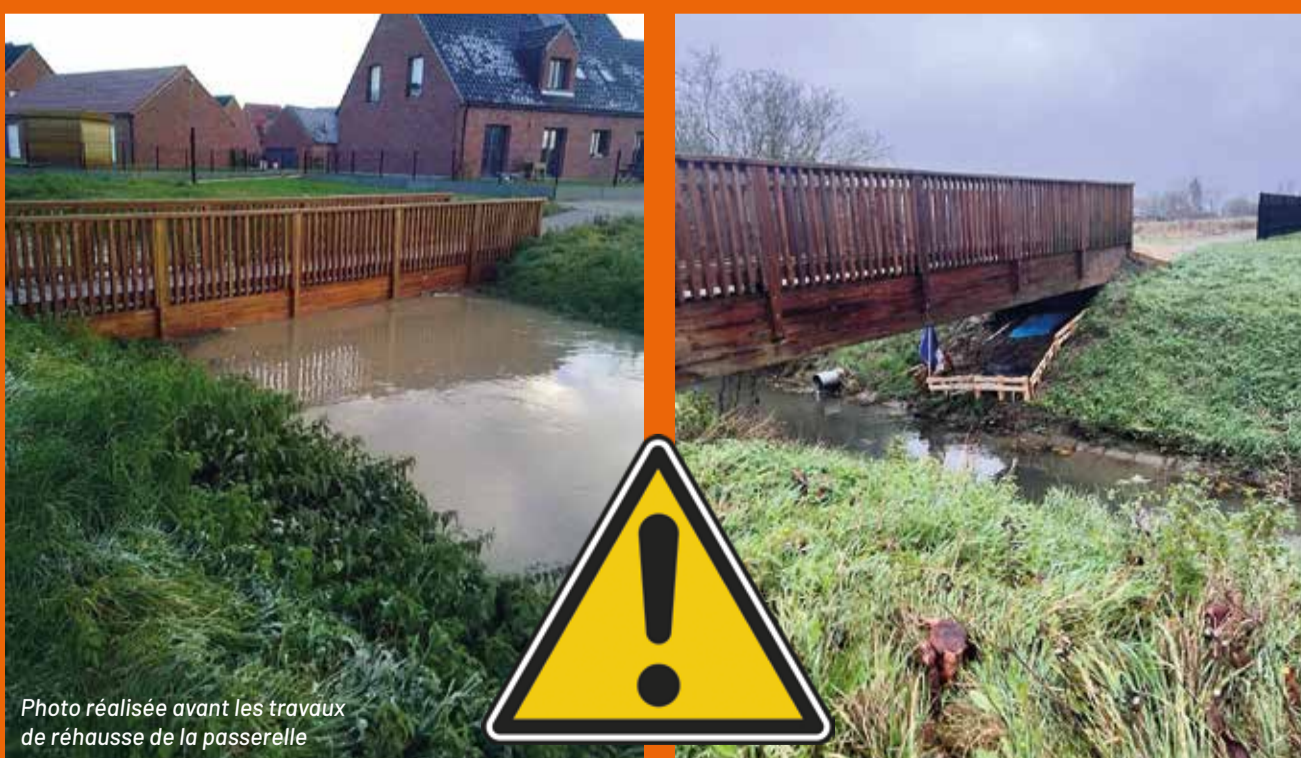
Photo réalisée avant les travaux de réhausse de la passerelle

L'Écho n° 60 présentait un plan de nos becques (Fleurbecque = Fleurbaix) et courants.