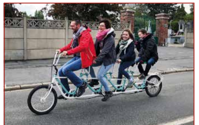
Tous à vélo