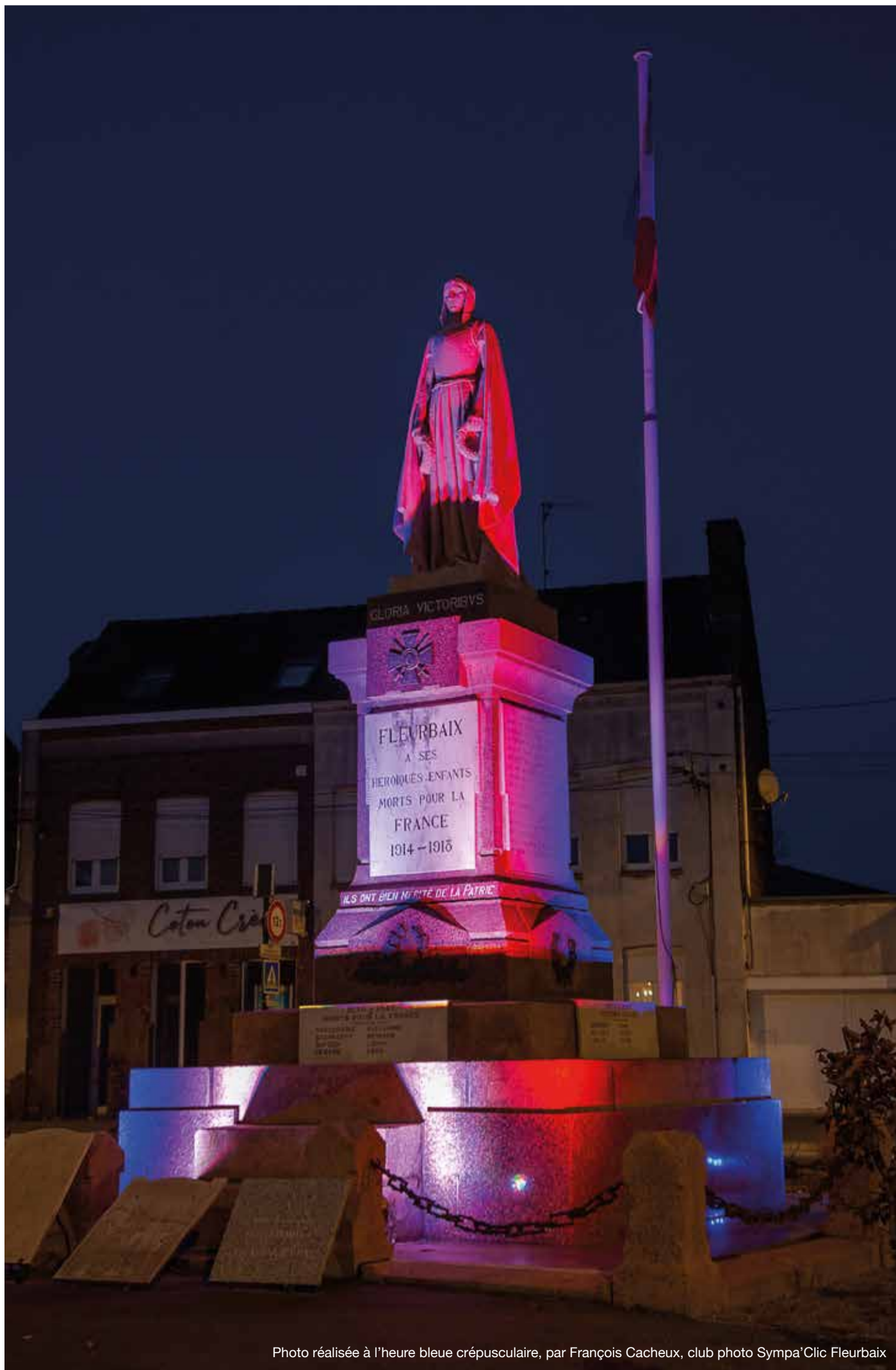
Photo réalisée à l'heure bleue crépusculaire, par François Cacheux, club photo Sympa'Clic Fleurbaix

Journal municipal de la commune de Fleurbaix - Quadrimestriel N° 63 - Février à mai 2025 Gratuit - Ne pas jeter sur la voie publique