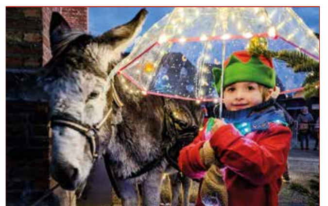
Balade des lumières